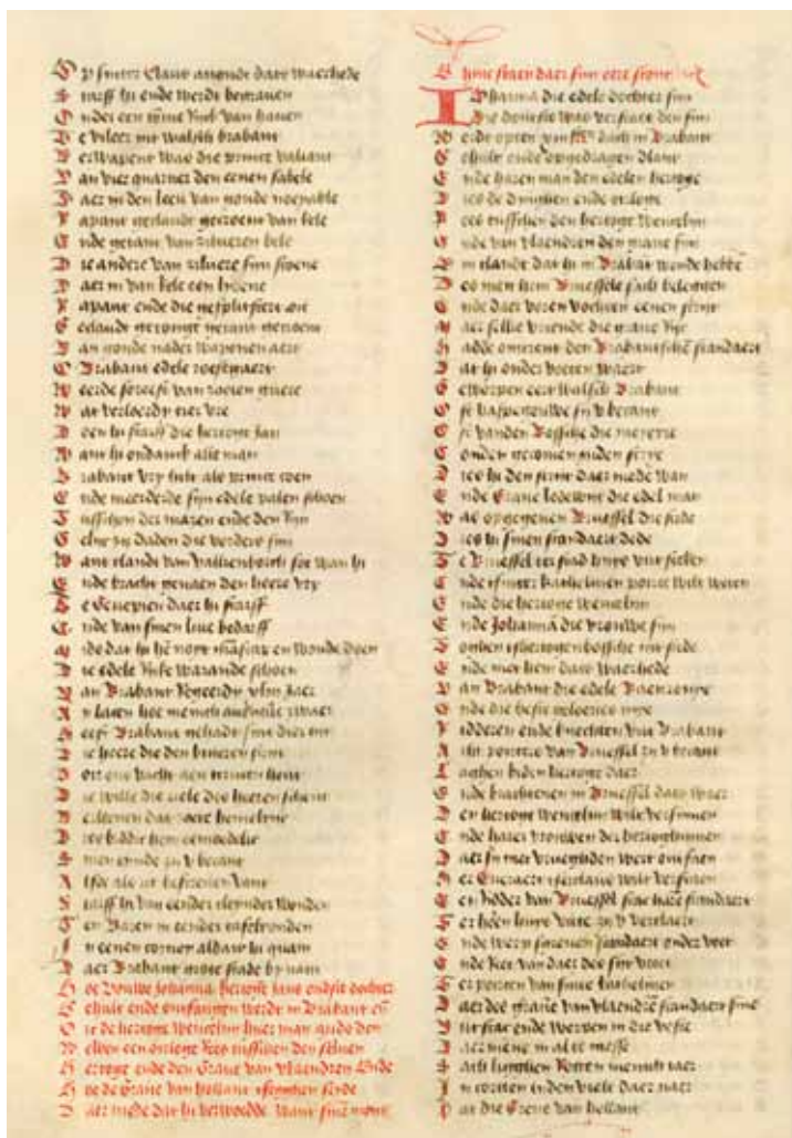
Passage uit de kroniek van Hennen van Merchtenen: in de rechterkolom wordt verteld hoe Everard T'Serclaes de vlag van de Vlaamse graaf neerhaalt en in de gracht werpt.