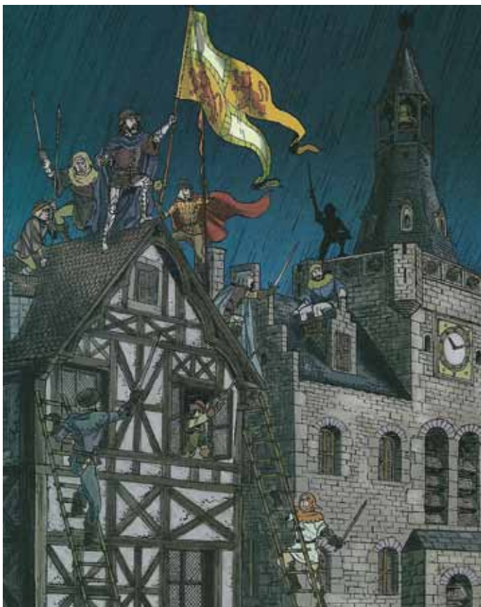
Vaak wordt verkeerdelijk verteld en getoond dat Everard T'Serclaes en zijn getrouwen de Vlaamse vlag van het huis de Ster haalden (terwijl ze op het stadhuis wapperde), zo ook in de recente strip Brussel van N. Van de Walle en J. Martin (© N. Van de Walle en J. Martin – Casterman).