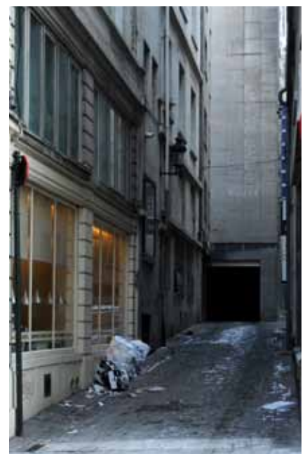
De T'Serclaesstraat, een groezelige steeg in hartje Brussel.

Pas na 1830 zou T'Serclaes' présence in het stadscentrum gevoelig toenemen. Op 17 juni 1851 doopte het stadsbestuur de Pelikaanstraat om in T'Serclaesstraat. 44 T'Serclaes' heldenstatus was mogelijk nog niet groot genoeg om hem een brede laan te schenken, want zijn naam werd immers gekoppeld aan een donkere en grauwe achterstraat. Toch was het wellicht geen toeval dat net deze steeg naar T'Serclaes werd vernoemd. Ze ligt namelijk op enkele passen van de plek waar hij in oktober 1356 de stadsmuur overklimde. Zo ontstond dan ook snel het verhaal dat hij via deze bochtige steeg (en dus buiten het zicht van de Vlamingen) naar de Grote Markt liep om er de Vlaamse vlag neer te halen. Ook de aanpalende Stormstraat kwam handig van pas: reeds in de achttiende eeuw meende men dat deze straatnaam herinnerde aan de bestorming van de stad door T'Serclaes en zijn gezellen. 45 De Franse vertaling van de straat heet trouwens nog steeds rue d'Assaut (letterlijk: Bestormingstraat). De werkelijkheid is minder prozaïsch. De namen van de Stormstraat en de T'Serclaesstraat (in de middeleeuwen Eggloystraat genoemd) verwijzen naar de bezittingen van de laatmiddeleeuwse Brusselse families Storm en Eggloy. 46 Of T'Serclaes effectief langs deze straten naar de Grote Markt is gelopen, zal nooit bewezen kunnen worden.