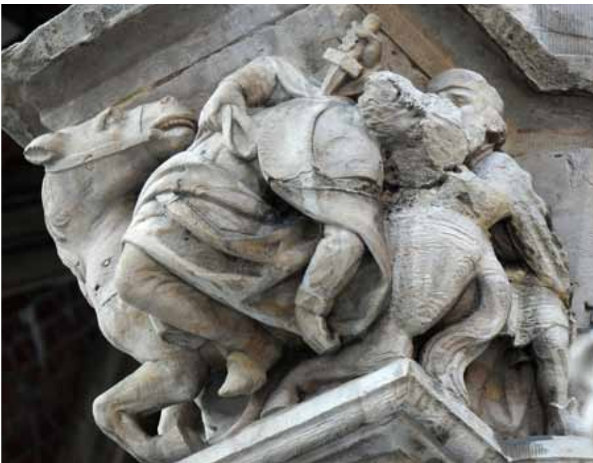
Kapiteel boven de Leeuwentrap van het Brusselse stadhuis, met afbeelding van de aanslag op Everard T'Serclaes.