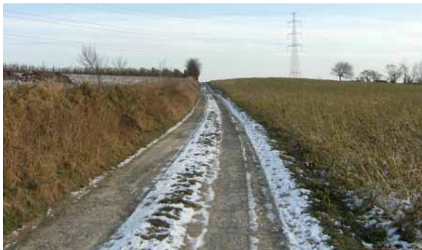
De landelijke Kwadewegenstraat op de grens van Lennik en Vlezenbeek, plaats-delict van de aanslag op T'Serclaes volgens de negentiende-eeuwse overlevering.

Men heeft zich ook gebogen over de plaats waar de aanslag op T'Serclaes precies plaatsvond. Zo wordt vaak beweerd dat de naam van de Kwadewegenstraat, op de grens van Sint-Martens-Lennik en Vlezenbeek, herinnert aan de aanslag. 34 De landelijke Kwadewegenstraat is een zijstraat van de Lenniksebaan, die Lennik met Brussel verbond (en verbindt). T'Serclaes kan er in 1388 dus effectief gepasseerd zijn. Etymologisch gezien houdt het echter geen steek om Kwadewegen – voor het eerst geattesteerd in 1609 35 – te verbinden met de aanslag op T'Serclaes. Er bestaan in Vlaanderen immers wel meerdere Kwadewegen en Kwadestraten . Het toponymisch bestanddeel 'kwaad' wijst daarbij op de slechte, erbarmelijke of moeilijk begaanbare staat van de weg (en niet op een 'kwade' gebeurtenis). 36