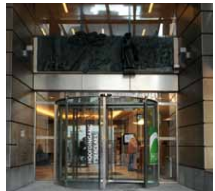
Het bas-reliëf van beeldhouwer Frantzen met scènes uit het leven van Everard T'Serclaes siert de ingang van het T'Serclaesgebouw.