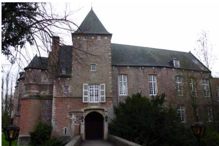
Het kasteel van Kruikenburg in Ternat. Het kasteel werd in de zeventiende eeuw herbouwd in classicistische stijl en voorzien van een lange dreef. In de negentiende eeuw werd een landschapspark aangelegd.

Over Everard T'Serclaes' bezittingen is heel wat minder bekend. Monteyne stelde dat T'Serclaes van jongs af bijzonder rijk was, maar volgens Clement is het moeilijk om uit te maken hoe hij zijn bezittingen precies heeft verworven. 7 Een belangrijke uitbreiding van zijn patrimonium gebeurde in 1381, toen de heer van Wezemaal hem een reeks bezittingen verkocht, met als belangrijkste goed het kasteel en de heerlijkheid Kruikenburg (waarvan Ternat, Sint-Katharina-Lombeek en Wambeek deel uitmaakten).