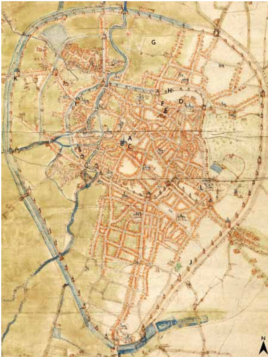
Fragment uit het zestiende-eeuwse stadsplan van Brussel getekend door Jacob van Deventer, met aanduiding van de Grote Markt (A) met het stadhuis (B) en het huis de Ster (C), het Etengat (D), de Eggloystraat (E), de Stormstraat (F), het Warmoesbroek (G), de eerste stadsomwalling (H) met de Sint-Kathelijnepoort (I), de tweede stadsomwalling (J) met de Vlaamsepoort (K) en de Koudenberg (L).

De tweede reeks van gebeurtenissen die bepalend zijn geweest voor de heldenstatus van Everard T'Serclaes, kadert in een aanslepend conflict tussen de stad Brussel en Sweder van Abcoude, heer van Gaasbeek. Als schepen van Brussel had T'Serclaes er begin 1388 samen met zijn medeschepenen voor gezorgd dat een gebiedsuitbreiding van het land van Gaasbeek was afgewezen door hertogin Johanna. Enkele weken later, op 26 maart 1388, werd T'Serclaes