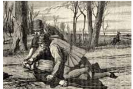
De aanslag op Everard T'Serclaes volgens een negentiende-eeuwse interpretatie (overgenomen uit Excursions et promenades , Bruxelles, s.d., p. 20).